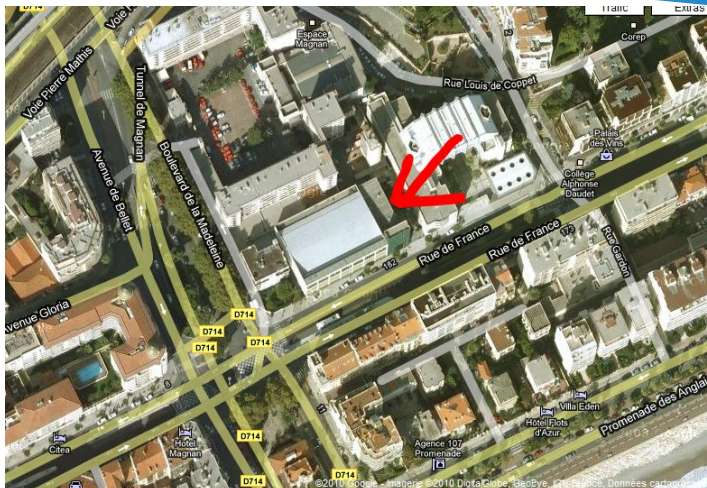
Piscine Jean Médecin , 178 rue de France 06000 NICE