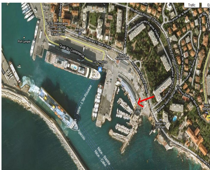
Aigle nautique, 50 bd Franck Pilatte 06300 NICE (Escalier et ascenseur en face du Club Nautique) Parking à proximité